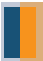
1/2 Seite hoch SP: 77,5×251,5 mm RA: 113,5×297 mm + 3 mm Beschnitt