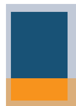
1/4 Seite quer SP: 160×59 mm RA: 210×81,5 mm + 3 mm Beschnitt

SP = Satzspiegel / RA = randabfallend • Randabfallende Inserate werden grundsätzlich auf der rechten Seite platziert.