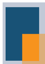
1/4 Seite hoch SP: 77,5×123 mm RA: 113,5×146 mm + 3 mm Beschnitt