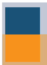
1/2 Seite quer SP: 160×123 mm RA: 210×146 mm + 3 mm Beschnitt